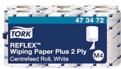
Tork Reflex Wiping Paper Plus M4 473472