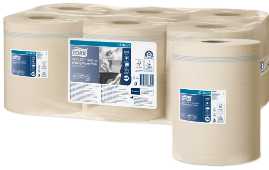
Tork Reflex Natural Wiping Paper Plus 473481