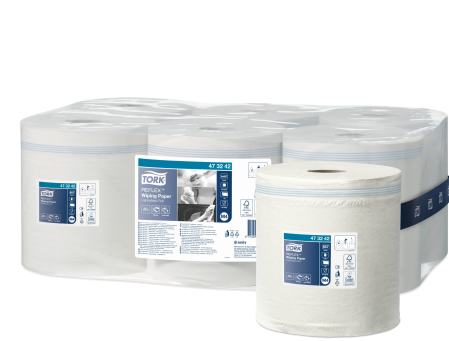
Tork Reflex Papel de Remoção 473242