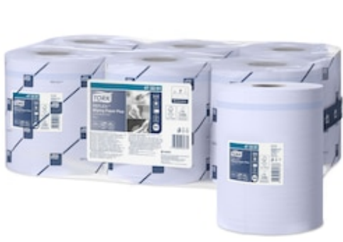
Tork Reflex Wip Pap Plus Blue M4 473391